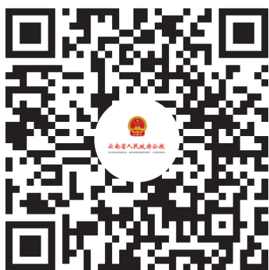
云南省人民政府公报小程序