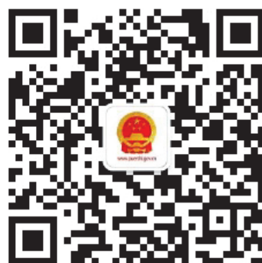
普洱市人民政府微信公众号